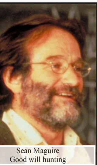
Sean Maguire Good will hunting