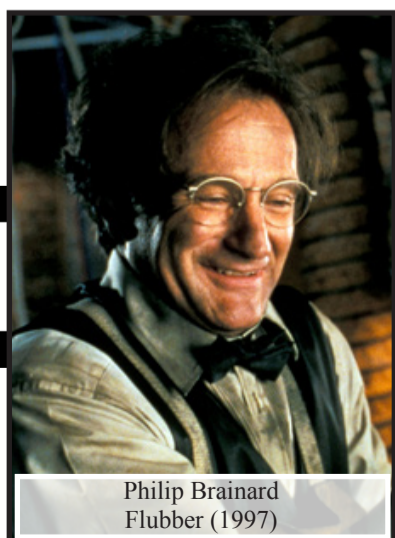
Philip Brainard Flubber (1997)