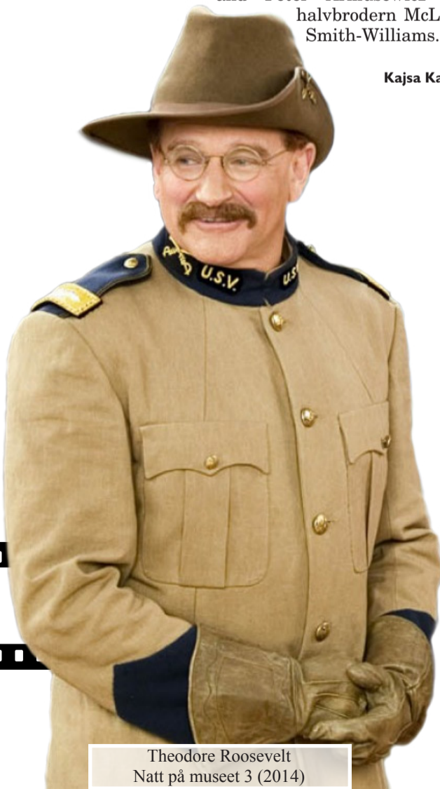
Theodore Roosevelt Natt på museet 3 (2014)