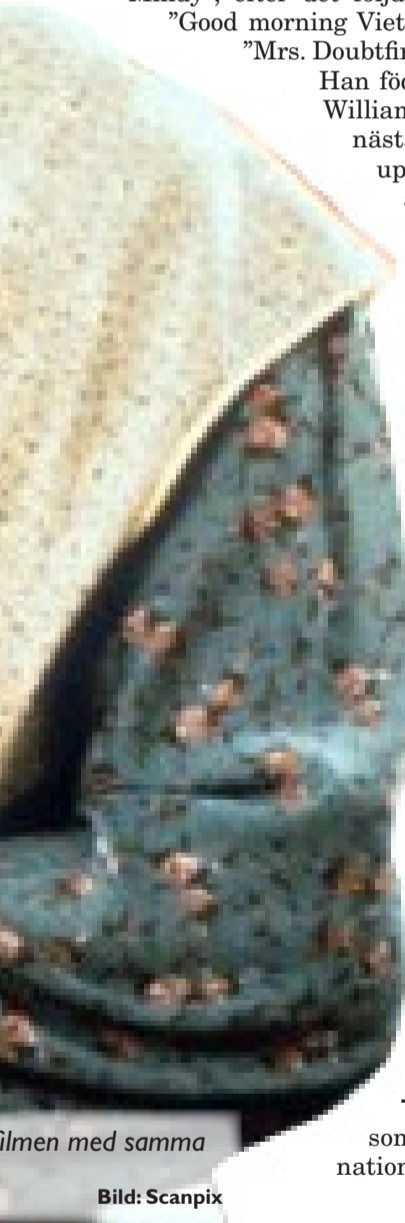
Filmen med samma