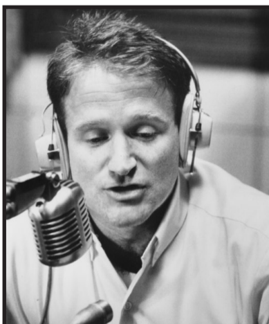
Adrin Cronauer Good Morning, Vietnam (1987)