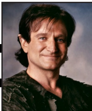
Peter Pan Hook (1991)