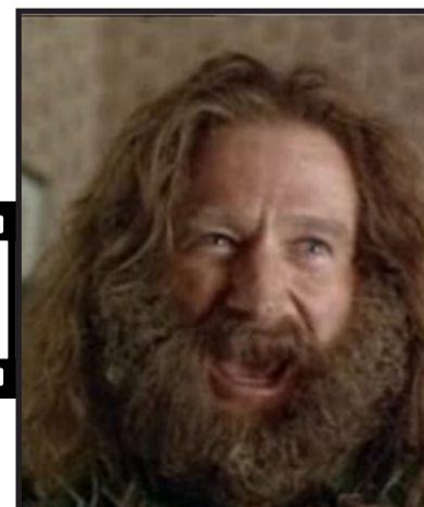
Alan Parrish Jumanji (1995)