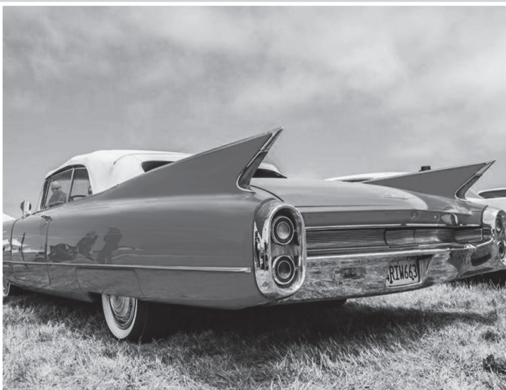
Cadillac Eldorado Biarritz Convertible från 1966.