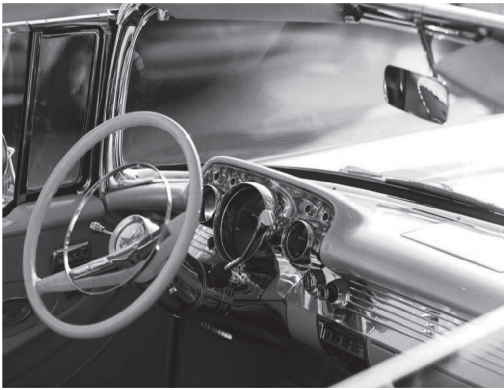
Designen betydde allt. Inifrån och ut.