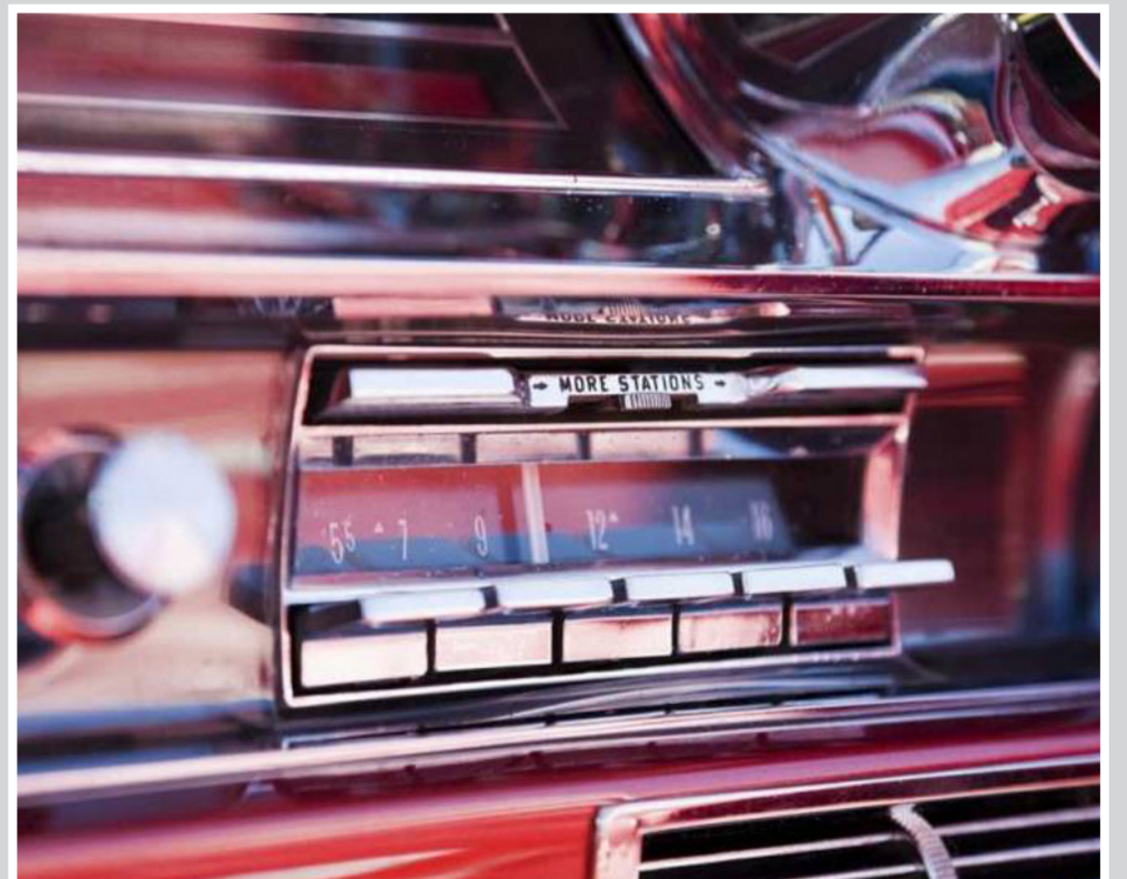
På femtiotalet var Elvis kung i radion.