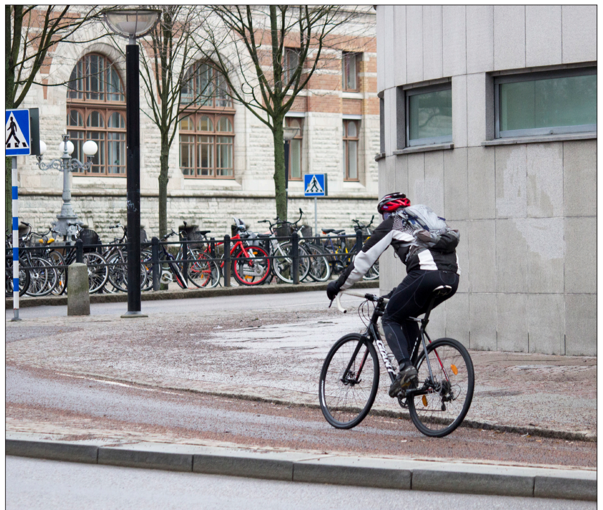
Vid det vältrafikerade hörnet utanför Handelshögskolan syns knappt marken.