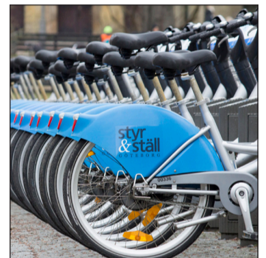
Göteborgs stads hyrescyklar ställs ut innan gruset sopats bort.

HYRCYKLARNA ställs ut den första mars i samarbete