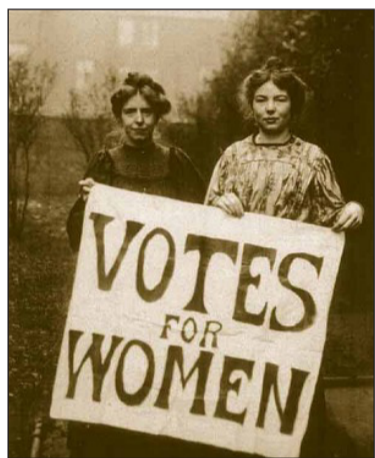
De legendariska suffragetterna Annie Kenney och Christabel Pankhurst lämpar för sin rösträtt.

Dåtidens feminister engagerade sig i rösträttsrörelsen som spred sig över Europa. Den tyska feministen och kommunisten Clara Zetkin stod i frontledet och var den som först lade fram förslaget om en internationell kvinnodag år 1910. Idén om en kvinnodag fick fäste och uppmärksammades året därpå av över en miljon människor ib-