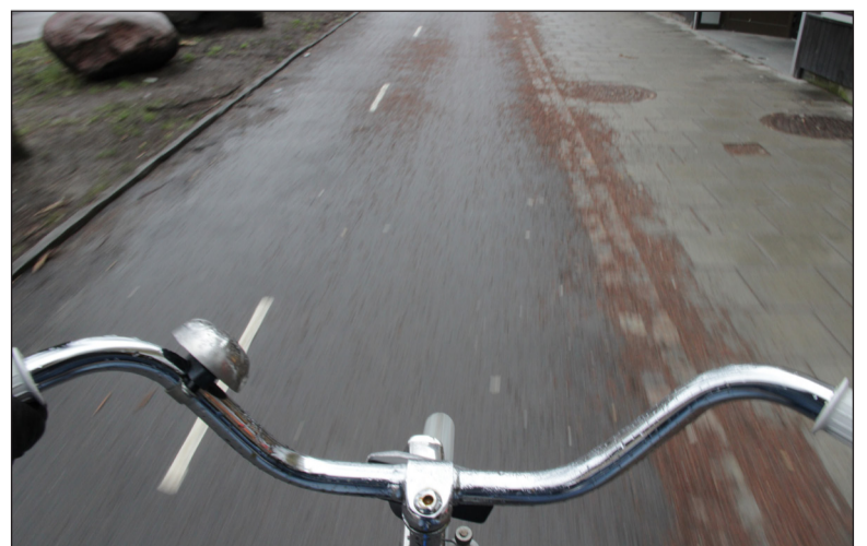
Vägen till redaktionen, inte ens en reporter är säker.